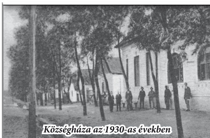
Községháza az 1930-as években